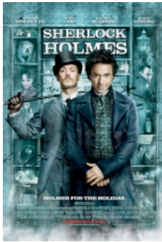
film de Guy Ritchie

Cette présentation a été suivie d'une longue discussion au sujet de la construction du scénario du dernier film mettant en scène Sherlock Holmes