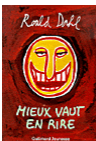
Mieux vaut en rire de Roald DAHL