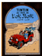
Tintin au pays de l'or noir